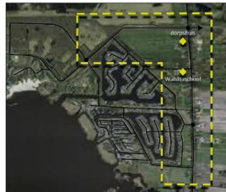
Afbeelding 1. Zoekgebied Kindcentrum

Binnen het zoekgebied zijn kavels in kaart gebracht die voldoende groot zijn en goed bereikbaar en toegankelijk zijn. Ook moeten er geschikte mogelijkheden zijn om het halen en brengen van kinderen in goede banen te leiden. Deze overwegingen hebben geleid tot 11 potentiële locaties (zie afbeelding 2).